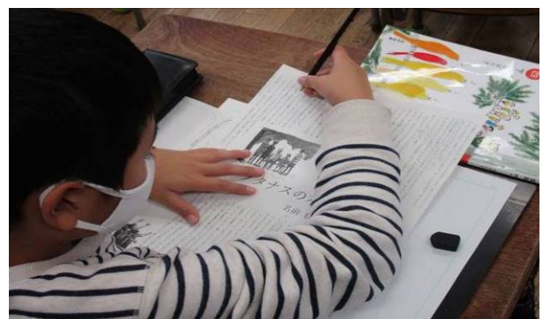
↑本文に線を引きながら考える