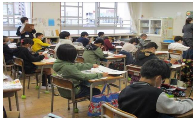
↑自分の考えをまとめる