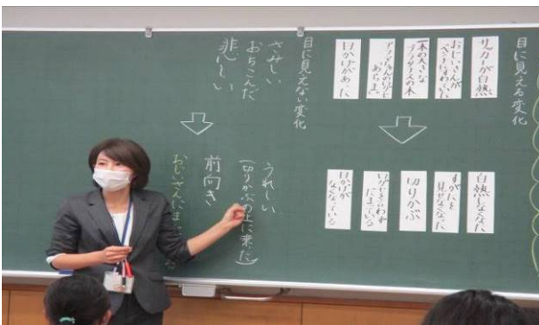
↑ワークシートの説明